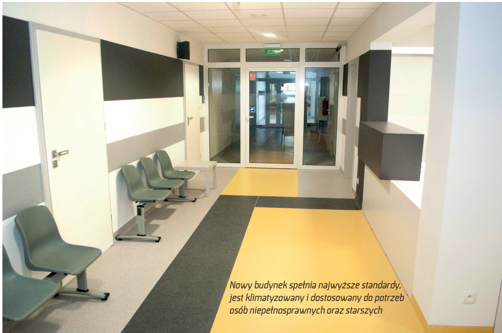
Nowy budynek spełnia najwyższe standardy, jest klimatyzowany i dostosowany do potrzeb osób niepełnosprawnych oraz starszych

Pacjenci polkowickiej przychodni już w sierpniu będą mogli skorzystać ze świadczeń w nowych gabinetach i poradniach. W wyremontowanych pomieszczeniach znajdować się będą gabinet gerontologii, gabinet logopedyczny, poradnia rehabilitacyjna, gabinet masażu, dział fizykoterapii oferujący zabiegi z użyciem pola magnetycznego, solluxu, aquavibronu, utradzwiązków i fali uderzeniowej, elektroterapia oraz elektroterapia skojarzona z terapią podciśnieniową, laser, wodolecznictwo w tym masaż wirowy kończyn